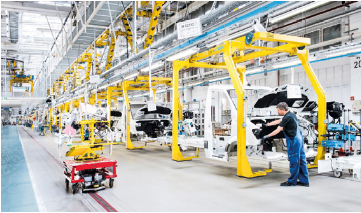
Intelligente Produktion im Mercedes-Benz Werk Ludwigsfelde