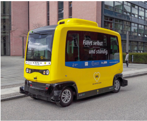
Fahrerloser Bus von EasyMile auf dem Campus der Charité

ckeln. Eine wichtige Rolle spielen dabei Themen wie Künstliche Intelligenz, Virtual und Augmented Reality, Car2X-Kommunikation und automatisiertes Fahren. Diese Technologien haben das Potenzial, den Verkehr in den Städten grundlegend zu verändern. Berlin bietet hervorragende Bedingungen für die Erprobung neuer Konzepte, z. B. im Bereich elektromobiler Logistik, vernetzter Mikromobilität mit neuen Kleinfahrzeugen oder innovativer Ladetechnologien. Seit 2010 unterstützt die Berliner Agentur für Elektromobilität eMO als zentrale Anlauf- und Koordinierungsstelle den Mobilitätswandel in der Hauptstadtregion und hilft, Best Practice Lösungen nachhaltig umzusetzen. Dabei verfolgt sie den Ansatz einer vernetzten, automatisierten, geteilten, weitestgehend elektrifizierten sowie sozial, ökonomisch und ökologisch nachhaltigen Mobilität.